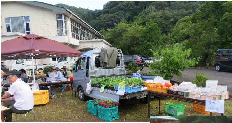
野菜苗なども販売