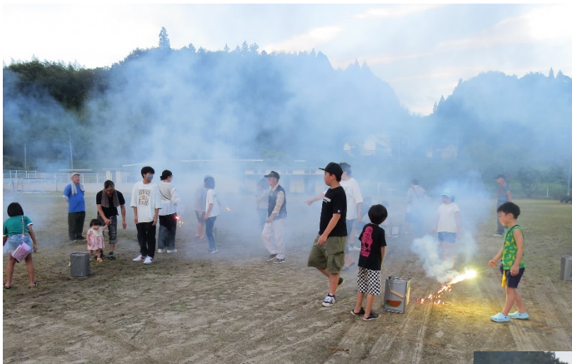
今年も子供花火を行いました。