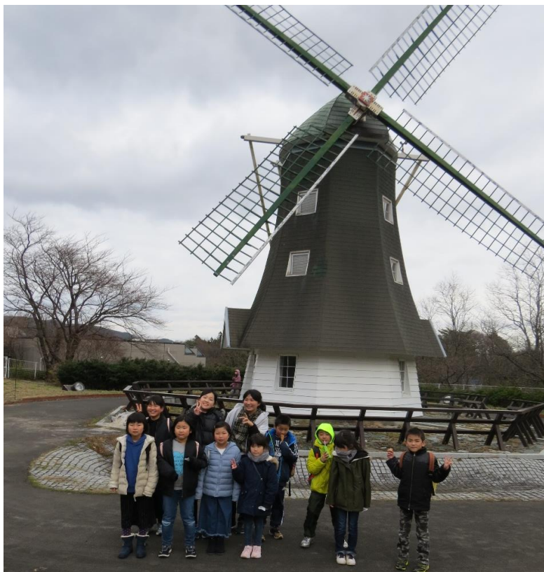
これは、外にあった 風車の前でまた記念撮影。 外の遊技は、立ち入り禁止で 遊べませんでした。 がっかり