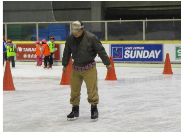
お父さんも初めて！