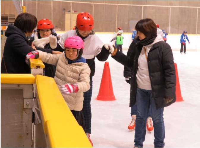
久しぶりのスケートで、最初は、ちょっと緊張ぎみ