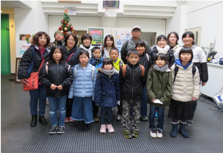
帰る前に記念撮影