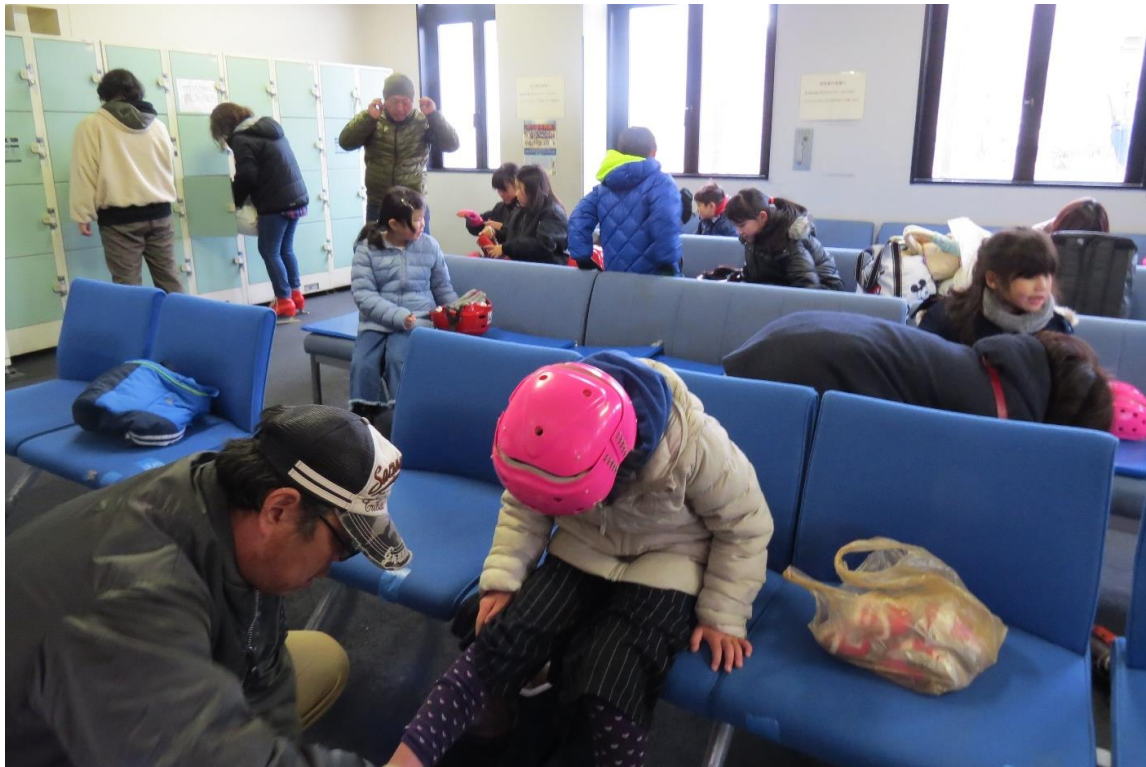
さあ、スケートも終わりです。足が軽い軽い！