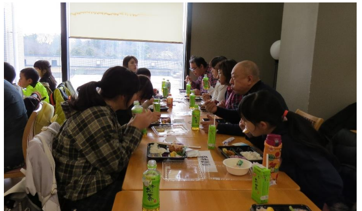
お昼は、ユラックス熱海でお弁当です。 ちょっと冷たかったのが残念でした。