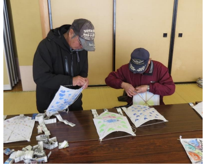
子どもたちが遊んでいる間、スタッフのおじさんたちは、風の糸をつけたり、足をつけたり忙しいです。