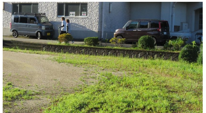
グラウンドも草だらけ