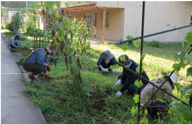
PTAのお母さんたちは、畑の草むしりです。