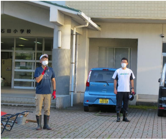
教頭先生の挨拶と、校長先生です。

今年もお盆の前に石田小のグラウンドや、校舎まわりの草刈り奉仕作業がありました。参加者は約40名