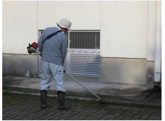
草刈りの達人ですねー！ きれい