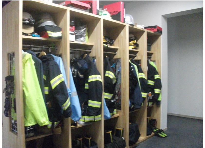
こちらは、火災のときに着る防火服。25キロもあるそうで！