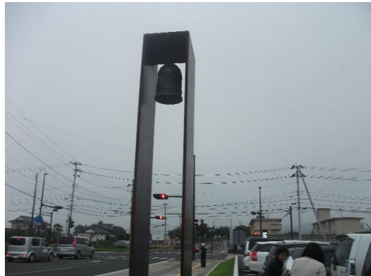
トリビア・・・消防署の看板の脇にまわると、こんな昔の半鐘がかけていたのです。知っていましたか？