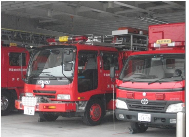
次は、消防車両の説明です。ピカピカに磨かれていました。