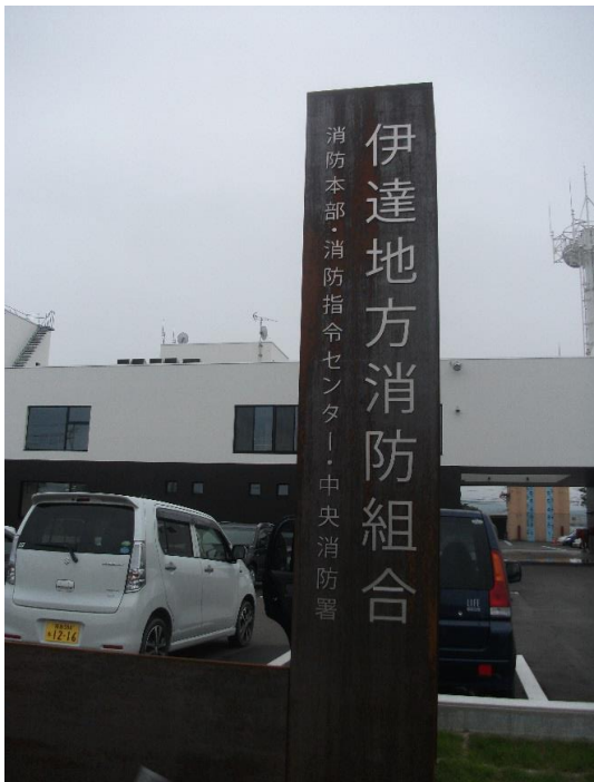
見学を終えてから、大雨や、土砂崩れの災害について、注意点などを写真をまじえてお話いただき、大変有意義な学習会となりました。