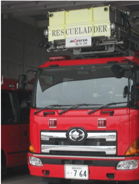
これははしご車です。25M伸びるそうです。