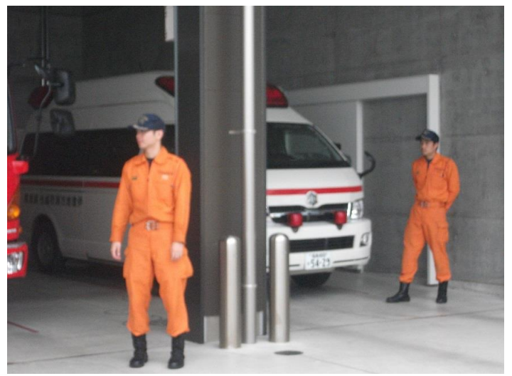
レスキュー隊の方も、毎日訓練をしています。カッコイイですね～！ 今年は、全国大会にでられるとか、というお話でした。