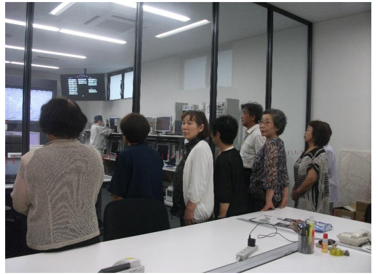
ここでも説明をうけました。