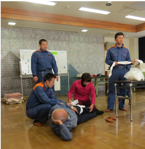
今度は、足をけがした場合のやり方です。