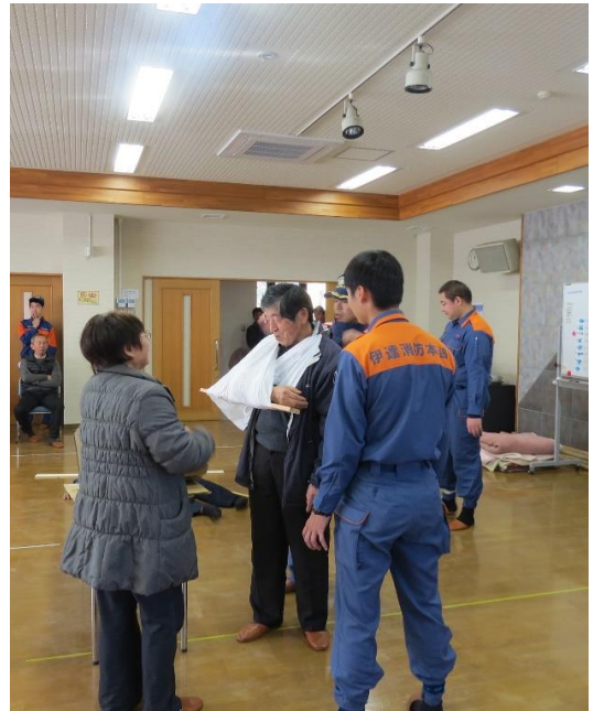
こちらは、腕をけがした場合のやり方です