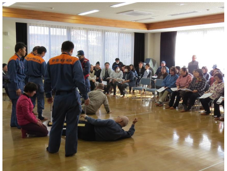
みんな熱心に耳を傾けていました。