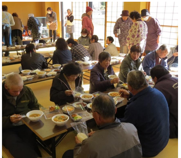
最後に炊き出しのおにぎりを食べて終了。美味しかったです。