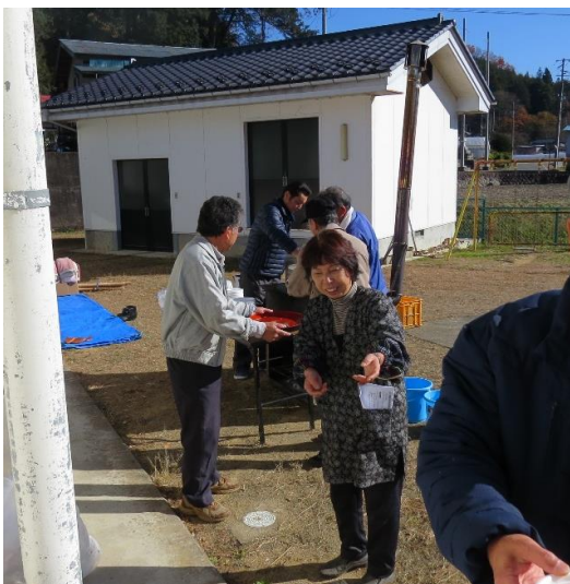
今年は、特別芋煮汁つきです。