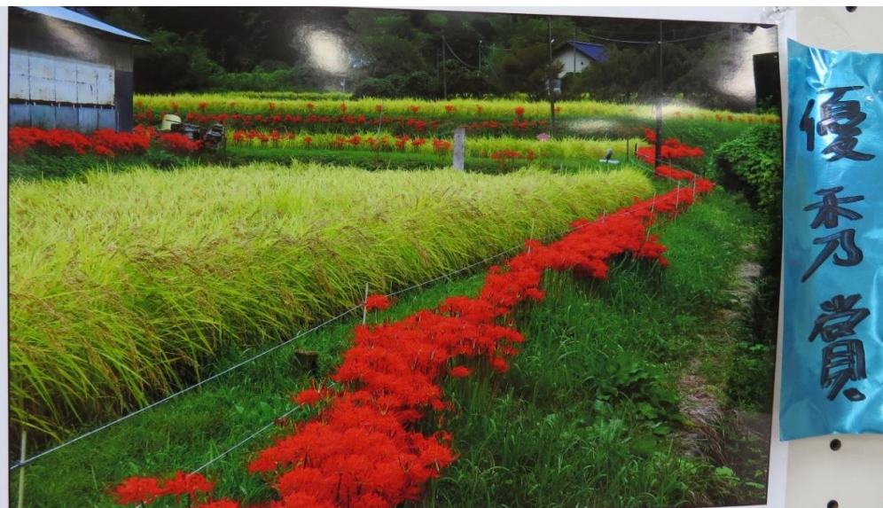
『秋のいろどり』 渡辺善宏