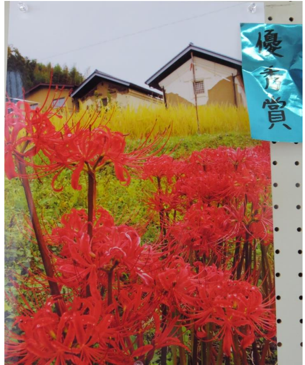
『古い蔵とヒガンバナ』井浦弘晃