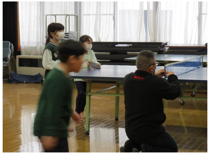
輪投げや卓球など、学校ではできない遊びです。