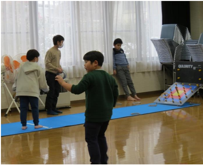
午前中は自由遊びです。